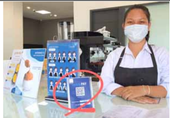
店頭用 QR コードスタンドも